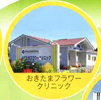
おきたまフラワー クリニック