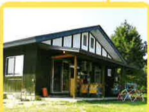
保育園バステルファミリー