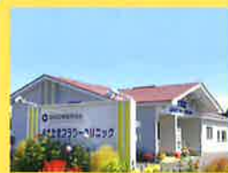
おきたまフラワー クリニック