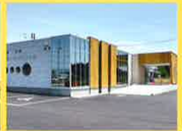
置賜・整形外科 まつきクリニック