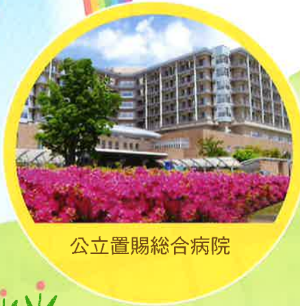
公立置賜総合病院