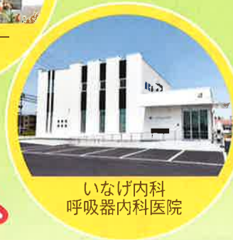
いなげ内科 呼吸器内科医院