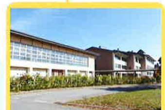
川西町立大塚小学校 1.3km