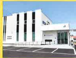
いなげ内科 呼吸器内科医院