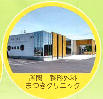
置賜・整形外科 まつきクリニック