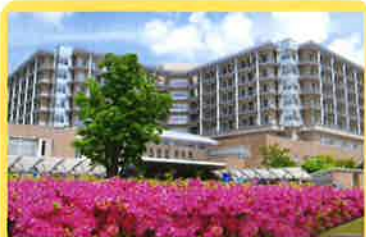
公立置賜総合病院 700m

また、令和5年度には梨郷道路も開通予定であり、当該分譲地南側にインターチェンジも整備され、通勤などの移動がますます便利になります。