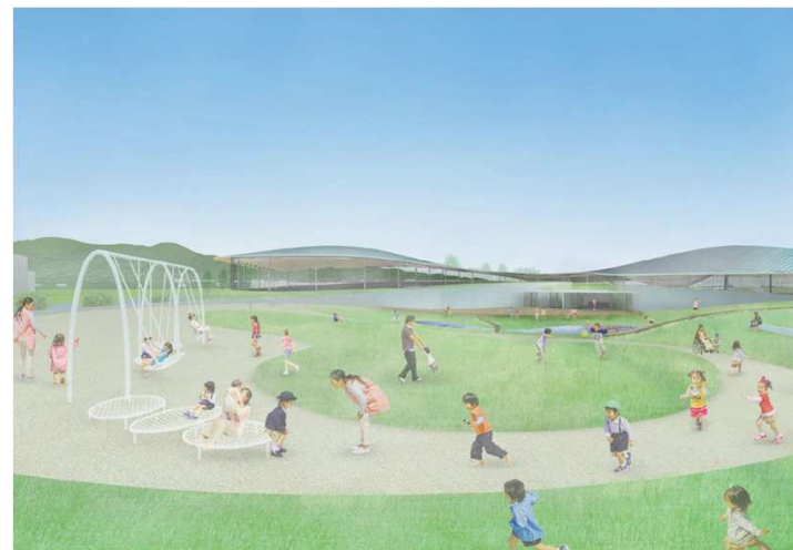
イメージパース